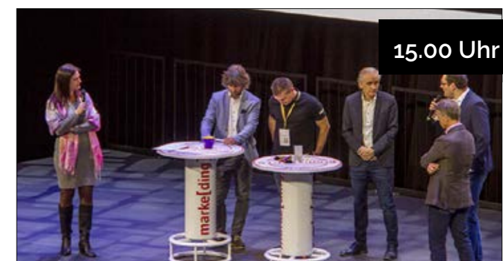
15.00 Uhr Die 7 Träger-Agenturen Der crossmediale Einsatz von Werbeartikel im Zeitalter der digitalen Transformation!